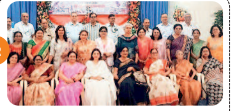
आईएमए ने किया 30 वरिष्ठ महिला डॉक्टरों का सम्मान