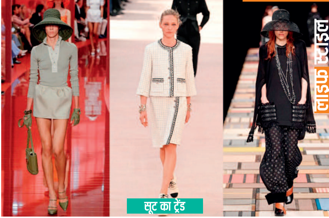
सूट का ट्रेंड